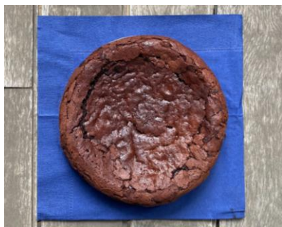
ガトーショコラ 6号