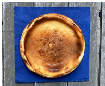
バイクドチーズケーキ 6号