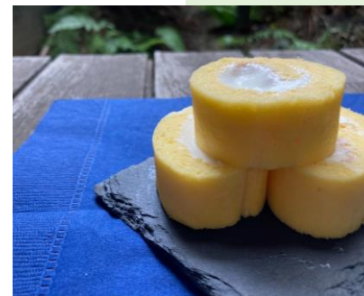
ミニロールケーキ (3本セット) 各24cm