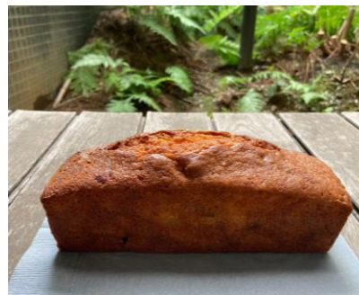
フルーツパウンドケーキ 21cm